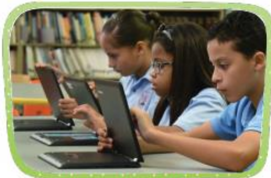
HAY ESCUELAS PRIVADAS. LAS FAMILIAS PAGAN UNA CUOTA TODOS LOS MESES. LOS NIÑOS SUELEN TENER QUE LLEVAR UN UNIFORME.