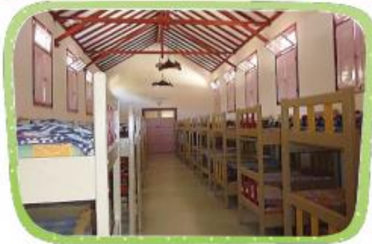
HAY ESCUELAS EN LAS QUE LOS NIÑOS DUERMEN PORQUE VIVEN MUY LEJOS.