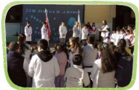
HAY ESCUELAS PÚBLICAS. SON GRATUITAS. EN LA MAYORÍA, LOS NIÑOS LLEVAN GUARDAPOLVO BLANCO.

LEE LAS SIGUIENTES FRASES Y ESCRIBE EN EL CUADERNO ÚNICAMENTE LAS QUE CARACTERÍZAN DE TU COLEGIO.