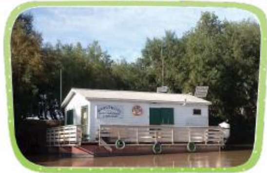
HAY ESCUELAS FLOTANTES UBICADAS EN ISLAS. LOS CHICOS LLEGAN A ELLAS EN LANCHAS.